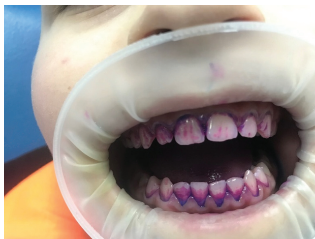
Рис.1. Фото дитини після використання розчину для виявлення залишків зубного нальоту

Індивідуальні профілактичні заходи проводили за загально прийнятою методикою у декілька відвідувань. В перше відвідування оцінювали стоматологічний стан порожнини рота (визначали індекс зубного нальоту (ОHI-S) та індекс гінгівіту (РМА), давали рекомендації по вибору засобів та предметів догляду за порожниною рота, по усуненню шкідливих звичок, навчали методів гігієнічного догляду за порожниною рота та проводили професійне чищення зубів. В друге відвідування оцінювали стан гігієни порожнини рота, проводили контрольоване чищення зубів та проведенням професійної гігієни порожнини рота. В третє та наступні візити оцінювали стан гігієни порожнини рота, при необхідності проводили контрольоване чищення зубів та їх професійне чищення. Кількість візитів залежала від рівня володіння гігієнічними навичками, що визначалося рівнем гігієни порожнини рота. Для виявлення зубного нальоту використовували розчин «Mira-2-Ton» (Miradent, Німеччина) (РБЗН). Розчин наносили на поверхні зубів мікробрашем. Через 30–40 секунд пацієнт спльовував слину. За кольором зубного нальоту визначали його вік (більше 24 годин – синій, свіжий – розовий колір) (рис. 1). Результат показували пацієнту.